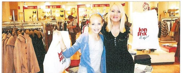
„Das schönste bonprix-Mutter-Tochter-jeans-Duo“ ging am Samstag auf große Shopping-Tour.