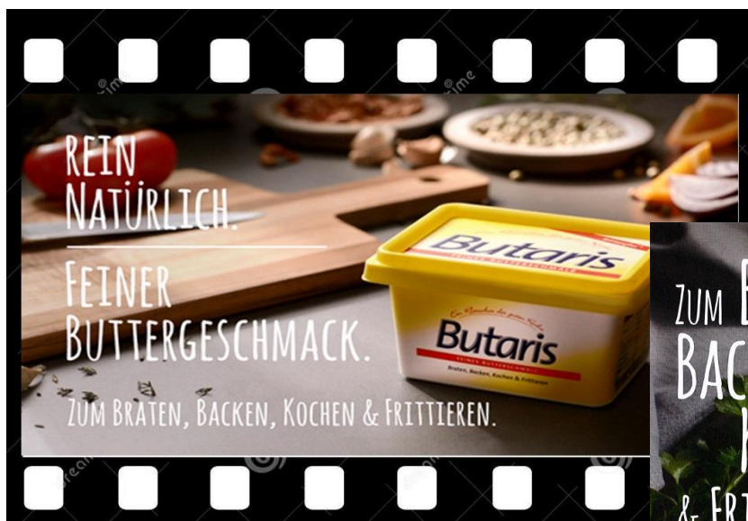
Screenshot TV-Spot BUTARIS