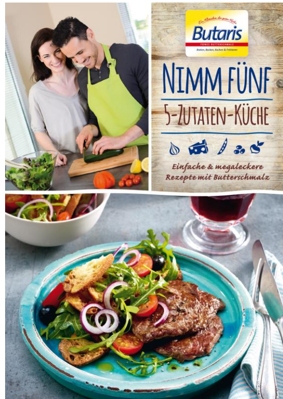
„Nimm Fünf“ Rezeptbroschüre 16/1 S.