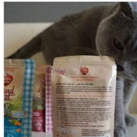
Futtertest: Wahre Liebe Landlust || Nassfutter