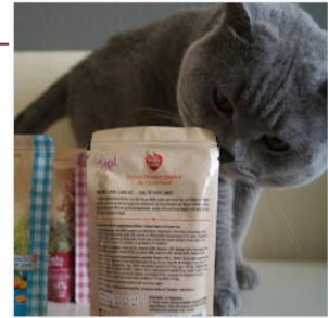
Futtertest: Wahre Liebe Landlust || Nassfutter